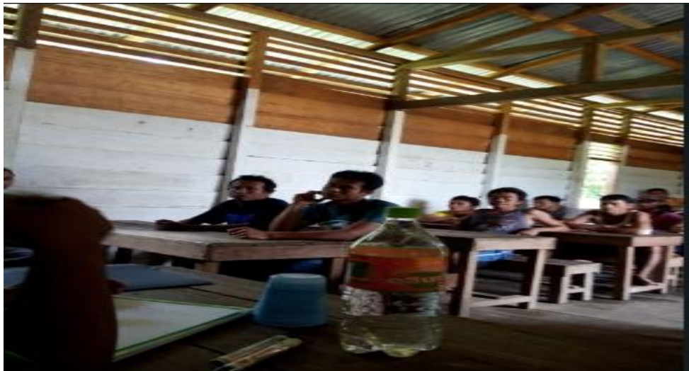
Gambar 5. Rapat komite kelas jauh

Pada malam itu juga disepakati untuk menyatukan persepsi kami, agar kelas jauh Tanjung Lesung, terus bisa berjalan dan bahkan berharap kedepannya bisa lebih ditingkatkan lagi, baik dari segi kedisiplinan dan juga kemajuan dari segi fisik maupun pembangunan gedung sekolah, karena memang sampai pada saat ini kelas jauh Tanjung Lesung, belum memiliki gedung yang layak untuk proses pembelajaran di sekolah. Selama ini siswa masih harus belajar di Balai pertemuan Dusun Tanjung Lesung.