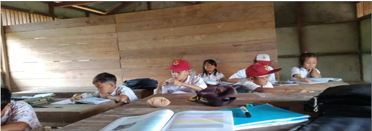
Gambar 6. Suasana belajar di Kelas Jauh Tanung Lesung