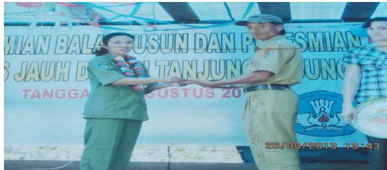
Gambar 1. Serah terima hibah tanan sebagai cikal bakal berdirinya sekolah jauh