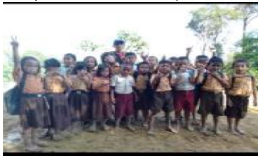
Gambar 3. Siswa kelas jauh Tanjung lesung

Sebelum lokal dibangun proses belajar mengajar dilakukan di balai dusun oleh seorang guru yang ditugaskan. Adapun siswa dan kondisi awal sebagai berikut: