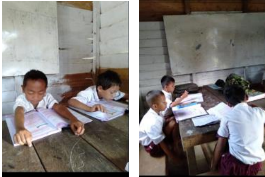
Gambar 4. Pembelajaran di Balai dusun

Setelah mendapat tanah hibah, sebelum dibangun sekolah, maka kegiatan pembelajaran dilaksanakan di Balai Dusun. Ditugaskan guru untuk mengajar di sekolah jauh ini. Namun demikian proses tidak berlangsung dengan lancar. Terjadi permasalahan selama sekolah jauh ini berlangsung, guru yang ditugaskan mendapat perlakuan yang kurang baik sehingga menjadi permasalahan tersendiri. Guru terkadang diperlakukan kurang menyenangkan dan ada pihak pihak yang mengganggu kelancaran berrjalannya sekolah.